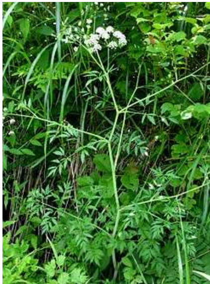
Pilt 1. Harilik mürkputk ( Cicuta virosa )

Mürkputk kasvab veekogude kaldaservades ja madalas kaldavees.