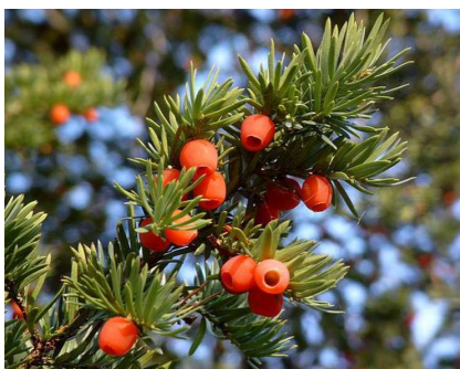
Pilt 4. Harilik jugapuu ( Taxus baccata )

Eestis tavaline. Maavitsa võib leida veekogudeäärsetest võsastikest, soodest ja lodudest. Marjade söömisel võib esineda iiveldust, oksendamist, valulikku kõhulahtisust, kiiret pulssi ja hingamishäiret, peapööritust, palavikku, rasketel juhtudel krambid ja kõnehäiret. Suurem osa mürgist väljub oksendamisel.