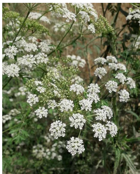
Pilt 2. Täpiline surmaputk ( Conium maculatum )

Mõne tunni jooksul võib mürgistus viia hingamise peatumiseni. Mürgistuskahtluse korral tuleb kohe kutsuda kiirabi.