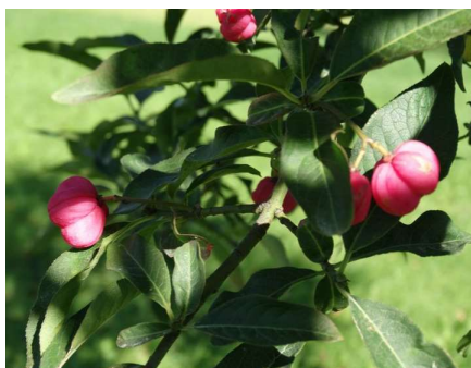
Pilt 5. Harilik kikkapuu ( Euonymus europaeus )

Eestis kasvab jugapuu Lääne-Eestis, peamiselt Hiiumaal ja Saaremaal. Mürgised on eelkõige jugapuu okkad ja seemned. Okaste ja seemnete söömisel tekib kõhulahtisus ja peapööritus, pupillide laienemine ja teadvusetus. Pulss muutub algul kiiremaks, siis aga nõrgemaks. Surm saabub krampide sagedes südametegevuse ja hingamise lakkamise tõttu.