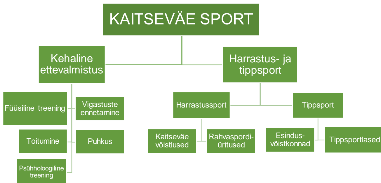
Joonis 1. KV spordi jaotus